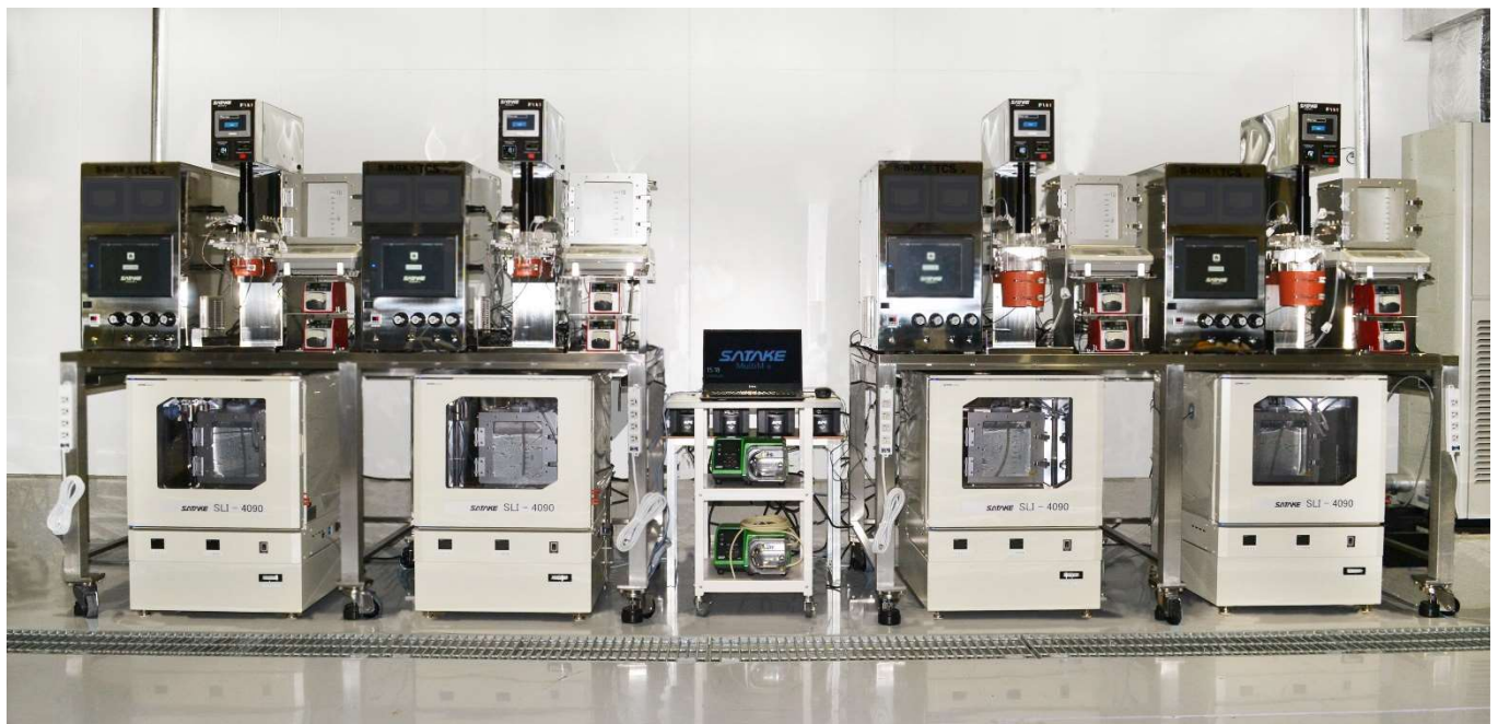
神戸医療イノベーションセンター（KCMI）へ導入を果たした 治験製品製造用シングルユース自動培養システム

本取り組みにおいて、ヘリオス社は全工程フィーダーフリー培養・完全閉鎖系での培養系を構築し、1バッチ当たり1000億個の対象培養に成功しており、今後試験運用が開始され、早期に患者さんへの投与を目指す。